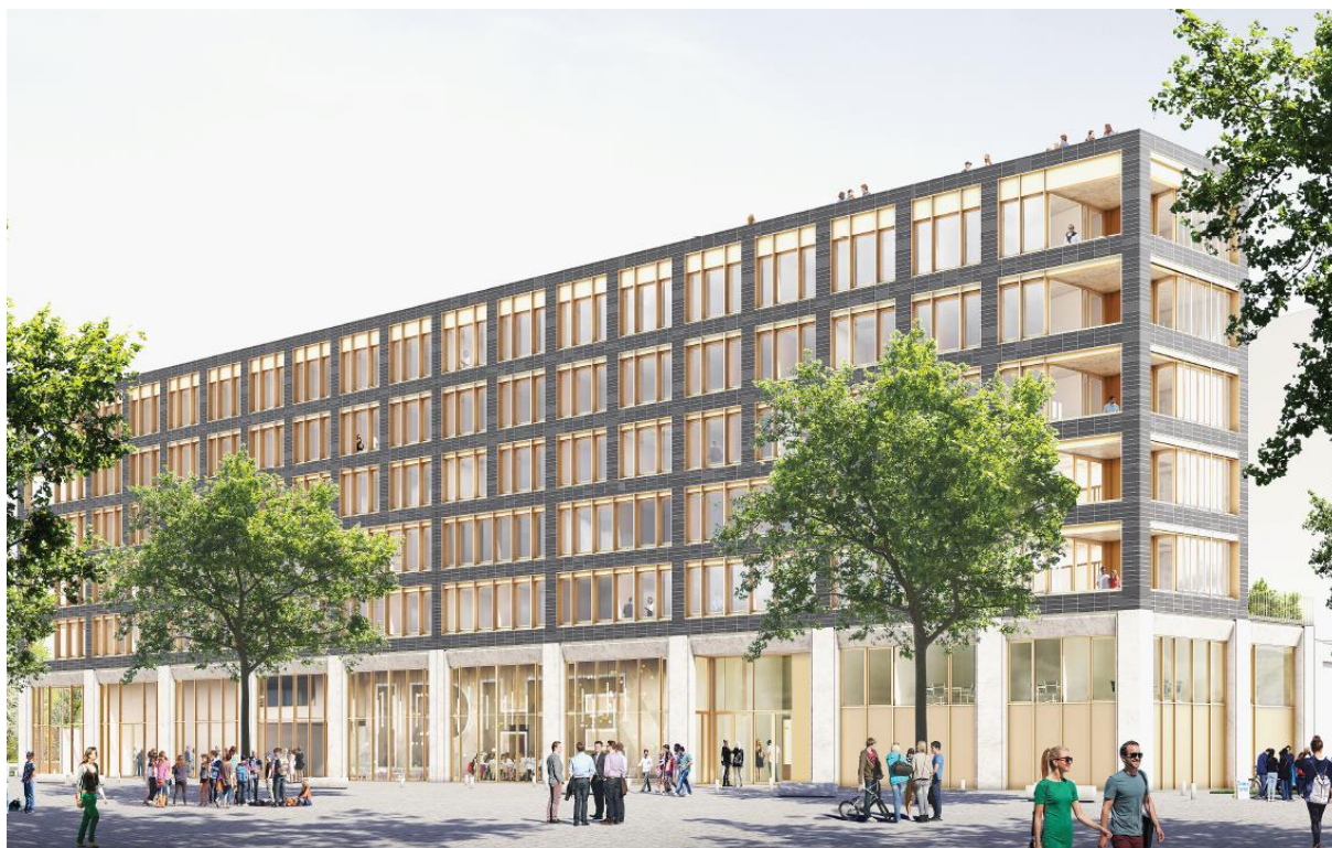
©Ignacio Prego Architectures | Perspective de l'Incubateur pépinière hôtel d'entreprises de Paris-Saclay

L'IPHE de Paris-Saclay (Incubateur pépinière hôtel d'entreprises) est un projet partenarial emblématique du territoire réalisé avec le soutien de nombreux partenaires publics : le Département de l'Essonne, la Région Ile-de-France, la Communauté d'agglomération Paris-Saclay, le Secrétariat général pour l'investissement (SGPI) dans le cadre du Programme des Investissements d'avenir et en partenariat avec l'Université Paris-Saclay et la ville de Palaiseau.